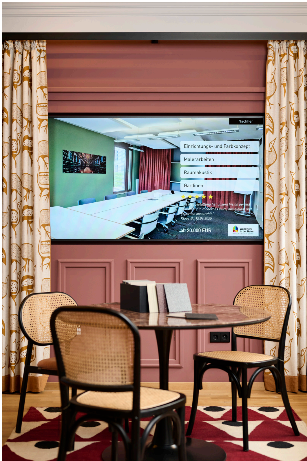
Ein großer Bildschirm zeigt die Referenzprojekte des Hauses. An einem zweiten finden Online-Beratungen statt.