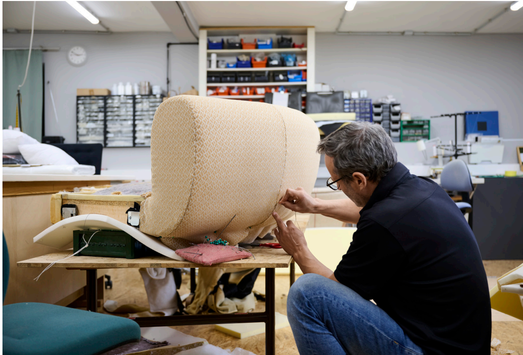
Verkaufsräume und offene Werkstätten wie die Polsterei machen die Vielfalt des Raumausstatter- und Malerhandwerks erlebbar.