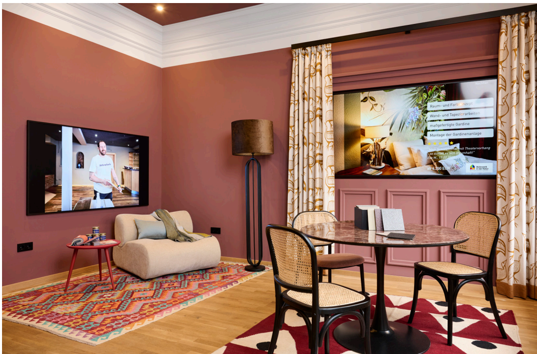
Im Rahmen des Förderprojekts „Future Retail Store“ wurden die Flächen überarbeitet, um Unternehmensphilosophie und das große Leistungs- und Kompetenzspektrum auch digital abzubilden.